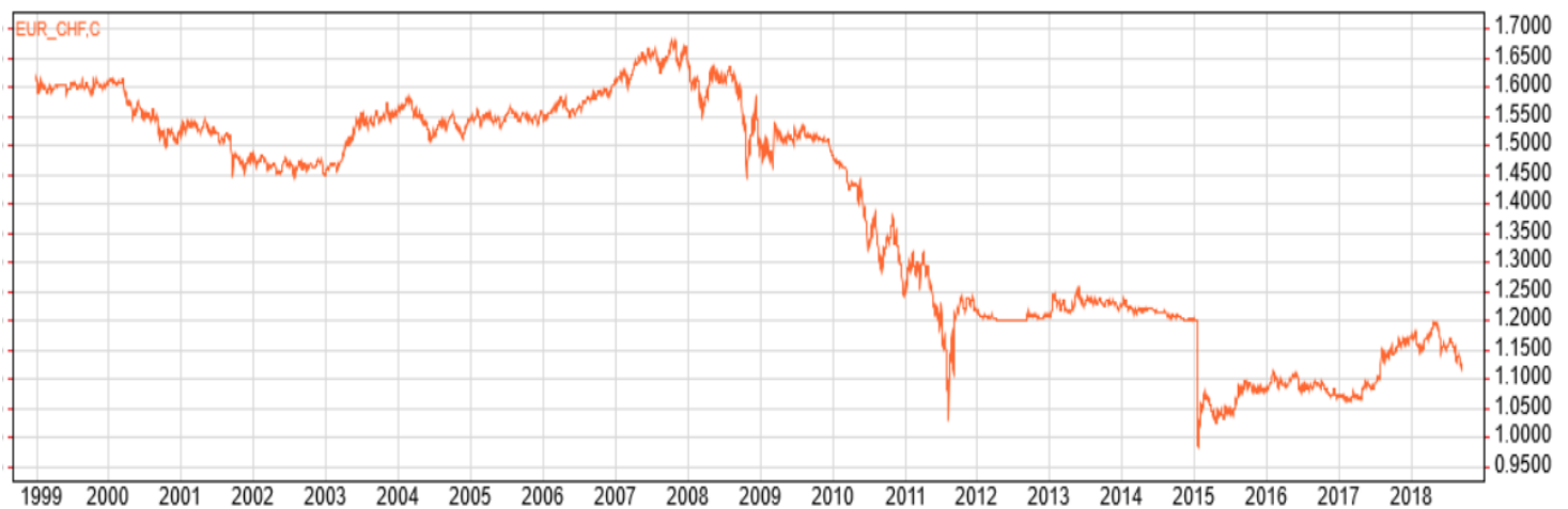
EUR/CHF Evolution du prix de 1 EUR en CHF

3. Après de superbes vacances au Portugal, près de Lisbonne, durant l'été 2008, tes parents ont remarqué, qu'ils ont dépensé EUR 2'500. Combien cela leur a-t-il coûté en CHF ?